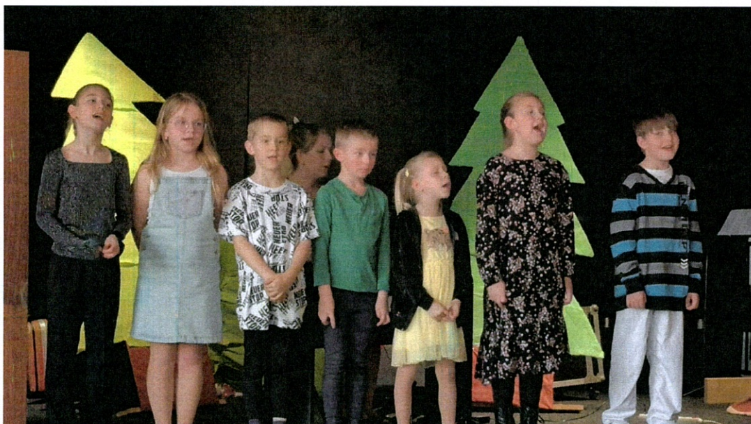
Představení Dráčovských Malíčků u příležitosti setkání občanů Dráchova, 07.03.2026